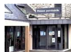
Maison paroissiale Ploubalay