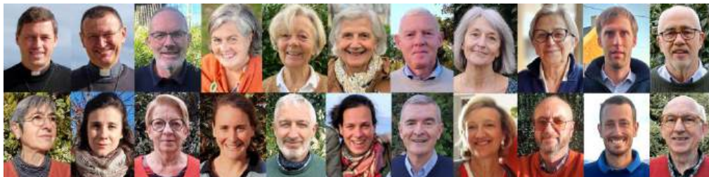
Le conseil pastoral, qui regroupe l'EAP, les responsables de pôles et des membres appelés

PAROISSE DE PLOUBALAY : Lancieux – Langrolay-sur-rance Pleslin – Plessix-Balissou – Ploubalay – Saint-Jacut-de-la-mer Trégou – Trémereuc – Trigavou 3 rue du général de Gaulle – 22650 Beausais-sur-mer