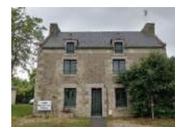
Salle paroissiale de Pleslin

Pour en savoir plus, ou pour vous investir , n'hésitez pas à prendre contact avec nous :