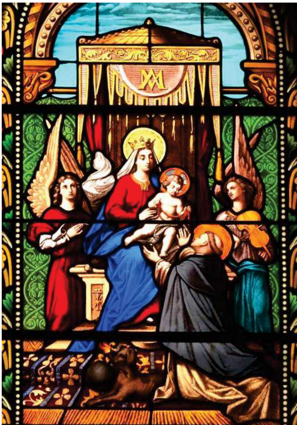
« Notre Dame du Rosaire » vitrail de l'église Saint-Pierre de Lezoux (63).

Notre Dame du Rosaire fêtée le 7 octobre