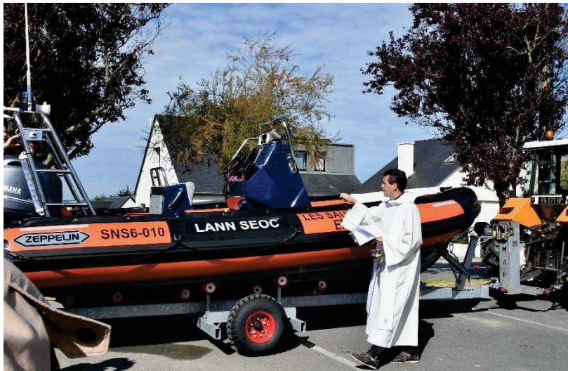
Bénédiction du bateau de la SNSM – samedi 25 mai