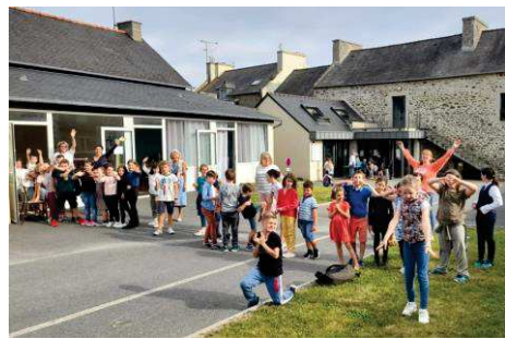
Reprise des Mardis Ensemble à Ploubalay depuis début septembre avec une cinquantaine d'enfants