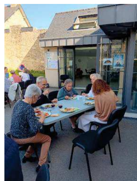
Dimanche 8 octobre : pot sur le parvis puis déjeuner-buffet partagé à la maison paroissiale sous un soleil radieux