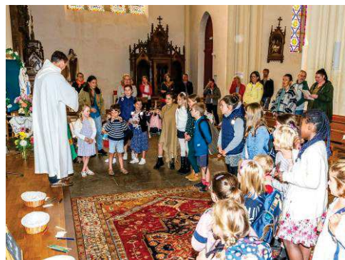
Dimanche 24 septembre : célébration Dimanche Autrement avec bénédiction des cartables