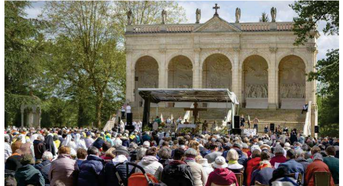
Lundi 1 er mai : pèlerinage pour les vocations à Pontchâteau à l'invitation des évêques de Bretagne et Pays de La Loire.