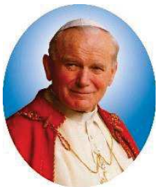
St Jean Paul II

Depuis, chaque pape de notre époque n'a de cesse d'encourager l'adoration eucharistique en dehors de la messe.