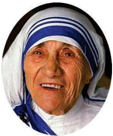
ste Mère Térésa