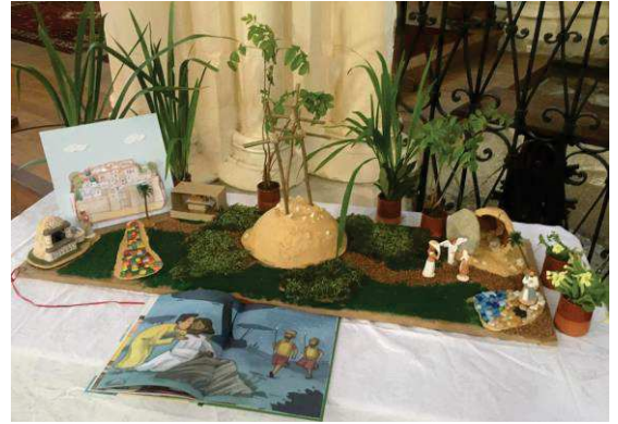
Samedi 15 avril matin : accueil devant l'église, proposition d'aller voir dans l'église le jardin de Pâques préparé par les enfants du patronage.