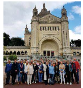
5 - 8 mai : pèlerinage à Alençon et Lisieux de l'Ecole des Disciples-Missionnaires sur les pas des Saints Louis et Zélie Martin et Ste Thérèse