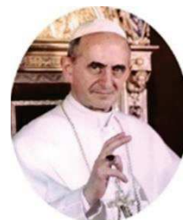
St Paul VI

Dieu nous donne la chance inouïe de pouvoir l'adorer concrètement, puisque nous nous retrouvons devant Dieu lui-même, dans l'hostie consacrée.