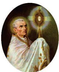
St Pierre-Julien Eymard

De nombreuses paroisses ont ressenti les fruits de cette chaîne de prière devenue centrale : « nous avons pu mesurer les fruits de cette prière constante aux pieds du Christ pour nous-même, nos familles, nos prêtres, et la communauté paroissiale : l'adoration est devenue le fondement de notre unité fraternelle, et source de fécondité. Au fur et à mesure qu'augmentait notre prière, notre paroisse était de plus en plus en mission, comme un vase communicant qui déborde naturellement de joie et d'Esprit Saint à partir du Cœur du Christ. » (V)