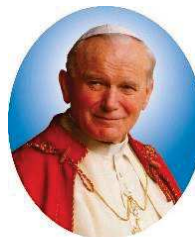
St Jean Paul II

« Par l'adoration, le chrétien contribue mystérieusement à la transformation radicale du monde. Toute personne qui prie le Sauveur entraîne à sa suite le monde entier et l'élève à Dieu. Ceux qui se tiennent devant le Seigneur remplissent donc un service éminent »