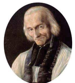
St Curé d'Ars

« Lorsque nous sommes devant le Saint-Sacrement, au lieu de regarder autour de nous, fermons nos yeux et ouvrons notre cœur ; le bon Dieu ouvrira le sien. Nous irons à lui, il viendra à nous, l'un pour demander, l'autre pour recevoir » Saint Jean-Marie Vianney (Curé d'Ars)