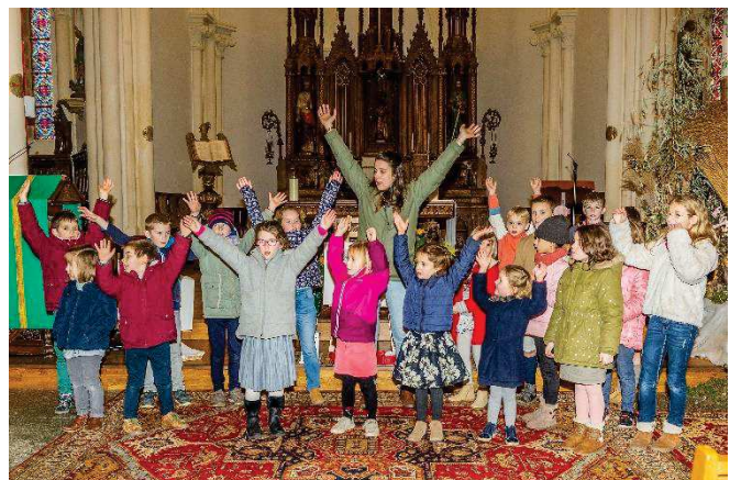
Célébration « Dimanche Autrement » le 5 février 2023