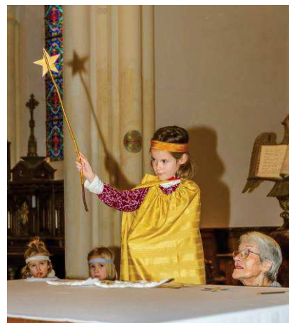
Dimanche Autrement du 4 décembre : crèche vivante dans l'église de Ploubalay