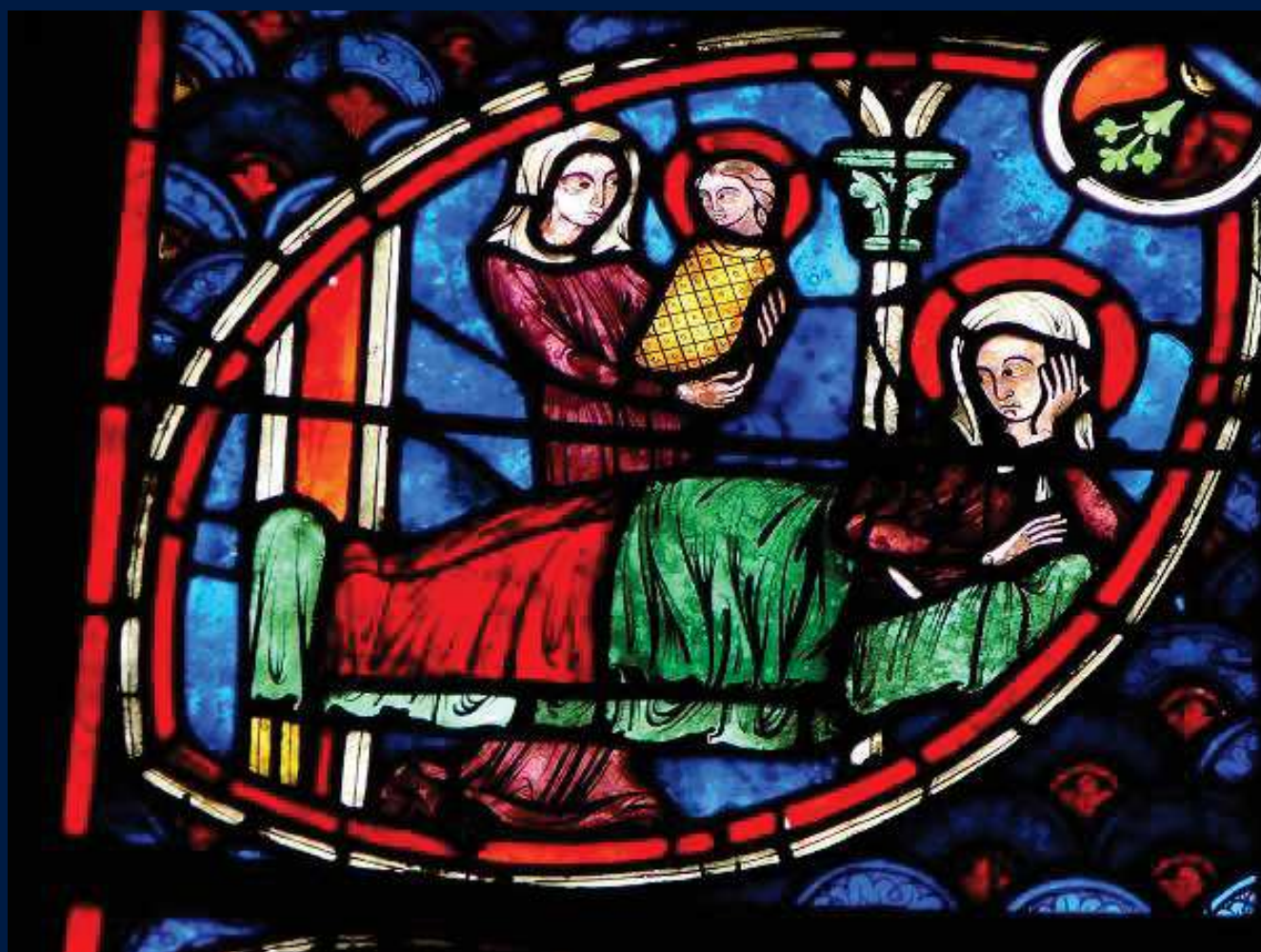
Naissance de Jean-Baptiste : Cathédrale Saint Etienne de Bourges

L'Eglise nous invite ainsi à reconnaître le Seigneur, à être ses témoins et à nous effacer devant sa grandeur.